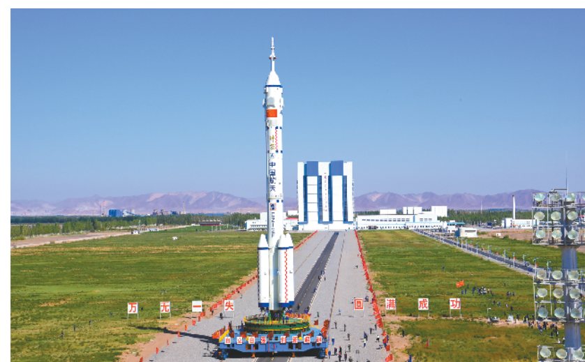
神舟十四号飞船组合体转运至发射区 计划近日择机实施发射

5月29日,神舟十四号载人飞船与长征二号F遥十四运载火箭组合体正在转运至发射区途中。