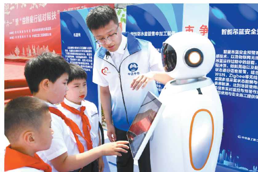
山东青岛:“益路童行”迎“六一”

扎尔扎伊廷油田位于阿尔及尔东南约1500公里处。新合约包括该区块内12口开发井的钻井工作、6口现有井的重新完井作业、现有设施的维护以及减少碳排放等。