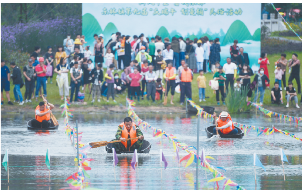
江南水乡“庆端午 划菱桶”

扩投资方面,上海将加强城市更新规划编制,政策支持和要素保障,年内完成中心城区成片旧区改造,全面提速零星旧区改造,年内新启动8个以上城中村改造项目。支持扩大企业债券申报和发行规模,将新型基础设施等纳入地方政府专项债券支持范围。