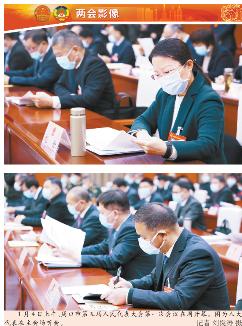
1月4日上午,周口市第五届人民代表大会第一次会议在周开幕。图为人大代表在主场听会。

谈到政府工作报告中提到“持续推进‘人人持证·技能河南’建设,加快人口大市向人才强市转变”,曹辉委员说,市委、市政府高度重视技能培训工作,截至2022年10月底,全市共完成各类职业技能培训31.78万人次,新增技能人才30.3万人,新增高技能人才8.44万人。但是在实地调研中也发现有部分技能培训存在针对性不强、农民对技能培训的认识不足、培训流于形式等现象。她建议,加大宣传力度,增强农民对参加技能培训的认识,特别是抓住农民工返乡高峰期,重点宣传就业形势好、市场需求多的工种,激发群众参与技能培训的热情。注重提高就业转化,根据市场需求,与企业、劳务公司相结合,大力推行订单式培训、定向培训、定向培训等,实现就业与培训无缝对接。为学员提供就业信息和就业推荐服务,最大限度提高就业率。同时,加大培训监管力度,改进培训方法、提高教学质量。②18