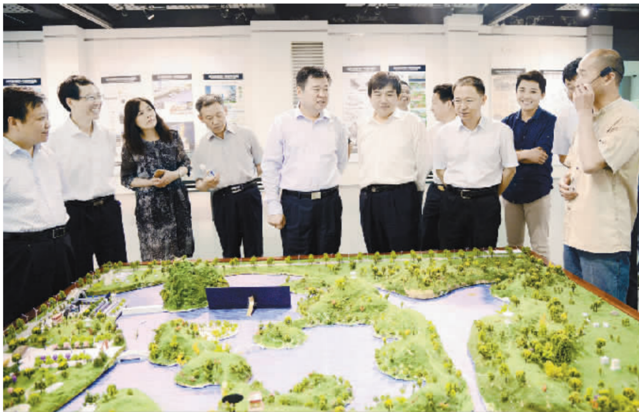
市委书记、市人大常委会主任徐光在周口师范学院调研。